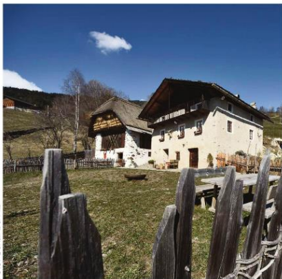
Der Felder Hof in Villanders von Studio Pavol Mikolajcak Architects.

Die Nominierungen für den 9. Architekturpreis Südtirol stehen fest. Auf der Online-Plattform kann das Publikum mitwählen.