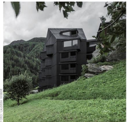
Hotel Bühelwirt von Pedevilla Architects