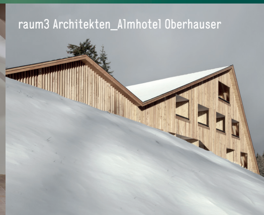
raum3 Architekten_Almhotel Oberhauser