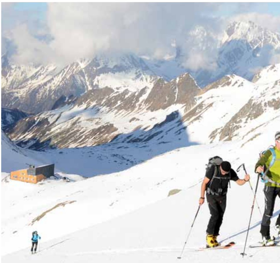
Rifugio Ponte di Ghiaccio/Edelrauthütte